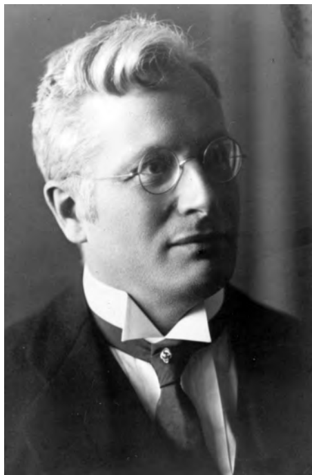
Porträt des noch jungen Gießener Staatsrechtlers Hans Gmelin, der 1919 wesentlichen Einfluss auf die Gestaltung der hessischen Verfassung ausübt.

im Januar 1919 „unter der Einwirkung der Revolution“ stattgefunden hatten. Unausgesprochen verbarg sich dahinter die Erwartung, dass man als bürgerlich-konservative Parteien nun besser abschneiden würde, nachdem sie sich seinerzeit noch in der Findungsphase befunden hatten und das eigene, dem Untergang der Monarchie lange nachtrauernde Klientel über den Umbruch politisch konsterniert und apathisch gewesen war. Zudem sei die Volkskammer wesentlich zur Ausarbeitung der Verfassung gewählt worden. Diese Aufgabe habe sie nun erledigt. 48