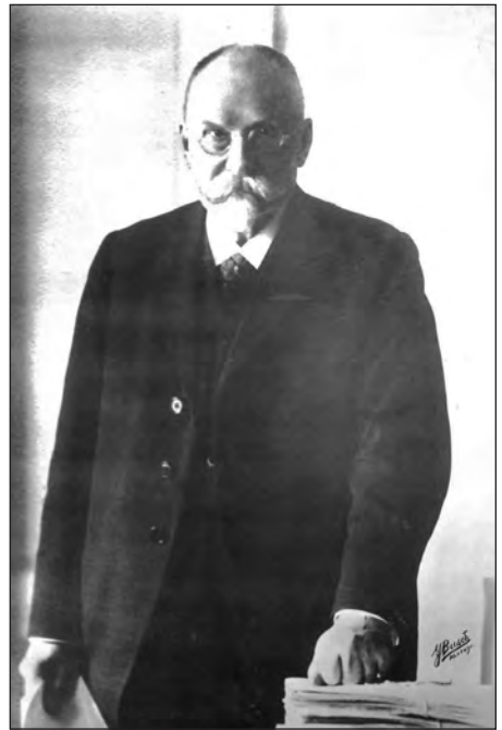
Der starke Mann in der Revolution und erster demokratischer Regierungschef in der hessischen Geschichte: der Sozialdemokrat Carl Ulrich.

Die Anträge zur Reform kamen aber nicht mehr in die Beratung. Es bewahrheitete sich die Mahnung von Ulrich, als er am 29. Oktober 1918 vor dem Landtag, der sich erst just an diesem Tag nach der überlangen Sommerpause seit Mitte Juli wieder versammelte, davon sprach, dass man des Öfteren mit Entscheidungen „zu spät gekommen“ sei: „Wären gewisse Entschlüsse früher eingetreten, so hätten wir höchst wahrscheinlich das Trübe und Traurige nicht erlebt, das wir leider im Reiche jetzt vor uns haben.“ 16 Es war in der Tat zu spät, um das Neue „in ruhigen Bahnen“ zu entwickeln, auch wenn man durch Eile das Ruder noch glaubte rumreißen zu können. Aber das – so Ulrich in seinen Er-