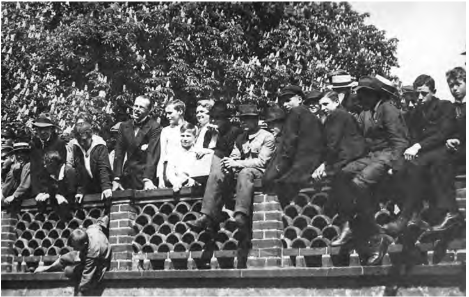
Ein Bürger unter Bürgern? Der seiner Regierungsmacht und Privilegien zwar beraubte, aber doch fürstlich abgefundene Großherzog Ernst Ludwig (über dem zweiten Pfeiler v. l.) beobachtet mit seiner Frau und seinen zwei Söhnen im Mai 1919 eine politische Kundgebung in Darmstadt.