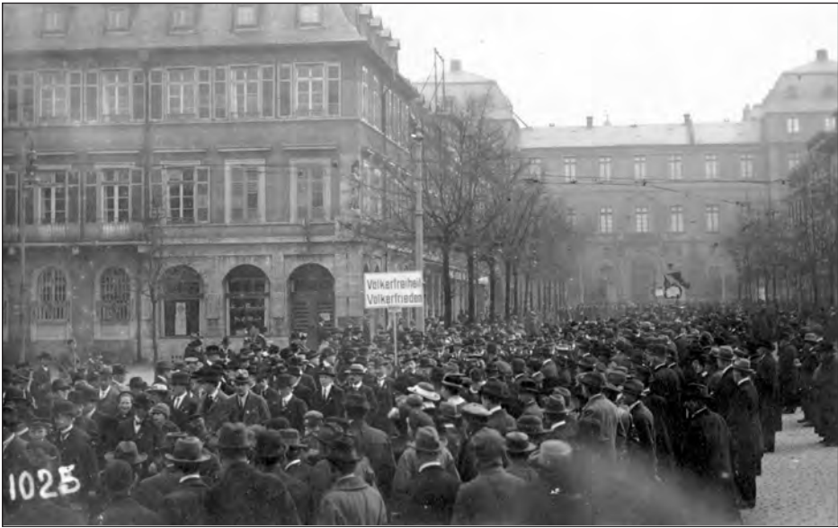
Massendemonstrationen wie hier in der Landeshauptstadt Darmstadt gehören zum Alltag in der Phase der Republikgründung 1918/19.

Am 14. November versammelten sich die hessen-darmstädtischen Arbeiter- und Soldatenräte zu ihrer ersten Landeskonferenz in Offenbach. Sie erkannten den in Darmstadt mit Vertretern der drei Provinzen und der vier größeren Städte erweiterten „Hessischen Arbeiter-, Bauern- und Soldatenrat“ als Zentrale an, der sich dann am 9. Dezember 1918 aufgrund der im Waffenstillstand verfügten Entmilitarisierung der neutralen Zone und dem damit verbundenen Truppenabzug aus diesen Gebieten als „Hessischer Landesvolksrat“, also nunmehr ohne Soldatenvertreter, konstituierte.