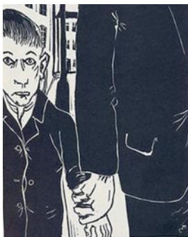
Aus dem Linolschnitt-Zyklus "Fürsorgeerziehung" von Carl Meffert aus dem Jahr 1929.

In unserem digitalen Podiumsgespräch werfen wir einen Blick auf diese Geschichte und diskutieren die Verantwortung der Sozialen Arbeit. Welche Kontinuitäten und Brüche lassen sich in Theorie und Praxis der Sozialen Arbeit erkennen, sowohl im Jahr 1933