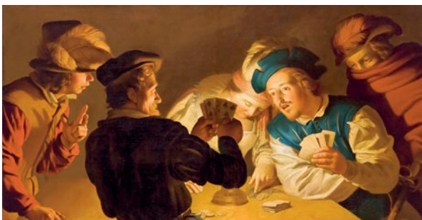
Gerard van Honthorst (1592–1656), Die Falschspieler Museum Wiesbaden