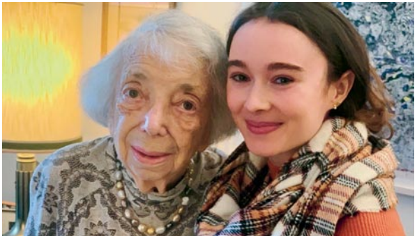
Filmstill aus „Ich bin! Margot Friedländer“.

Margot Friedländer wurde 1921 geboren und lebte mit ihrer jüdischen Familie in Berlin. Von den Nationalsozialisten wurde sie zur Zwangsarbeit verpflichtet, konnte jedoch einige Monate in Berlin untertauchen, bevor sie ins Konzentrationslager Theresienstadt deportiert wurde. Nach dem Krieg hat sie erfahren, dass ihre Familie in Auschwitz ermordet wurde. Zunächst wanderte sie in die USA aus, kehrte jedoch nach Deutschland zurück. Noch heute leistet die über 100 Jahre alte Margot Friedländer wichtige Aufklärungsarbeit und setzt sich gegen das Vergessen ein. Der Film mischt Spielfilmszenen mit Interviews mit Margot Friedländer.