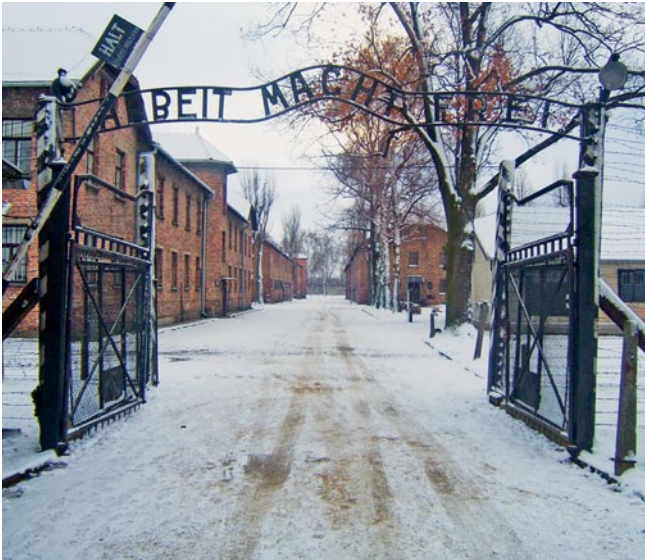
Staatliches Museum Auschwitz-Birkenau: Eingang zum früheren Konzentrationslager Auschwitz I.