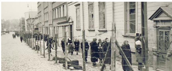
Die Umzäunung des Ghettos Riga an der Lāčplēša iela 161-163, Oktober 1941.

Die Ausstellung möchte dazu beitragen, die Deportationen nach Riga und das nationalsozialistische Morden im öffentlichen Gedenken Deutschlands wie auch Lettlands zu verankern.