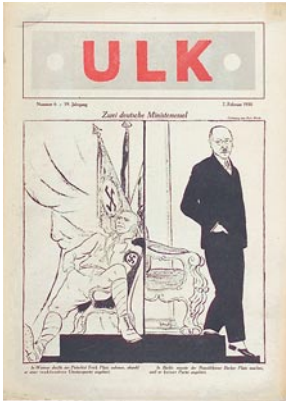
Karikatur des thüringischen Innen- und Volksbildungsministers Wilhelm Frick (NSDAP) auf dem Titelblatt der Satirezeitschrift Ulk (7.2.1930).

Im Land Thüringen (mit Unterbrechung ab Januar 1930) sowie in den Freistaaten Braunschweig (ab Oktober 1930), Mecklenburg-Strelitz (ab April 1932), Anhalt (ab Mai 1932), Oldenburg (ab Juni 1932) und Mecklenburg-Schwerin (ab Juli 1932) gelangte die Nationalsozialistische Deutsche Arbeiterpartei (NSDAP) bereits während der Staatskrise der Weimarer Republik in die Regierungsverantwortung.