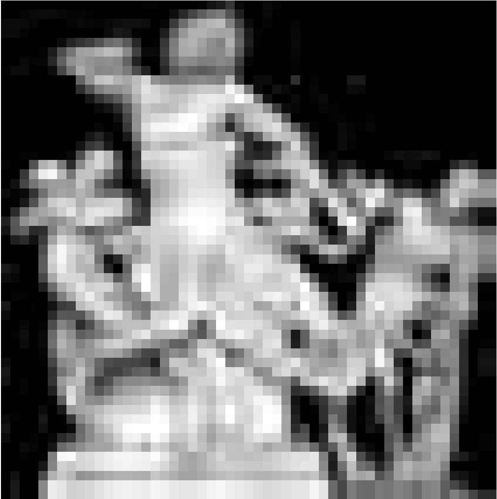
Abb.: Laokoon-Gruppe, Vatikanische Museen, URL: https://de.wikipedia.org/wiki/Laokoon-Gruppe#/media/File:Laocoon_and_His_Sons_black.jpg